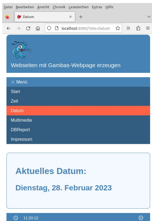
Abbildung 24.6.2.5.2: Vertikales Menü in deutscher Sprache