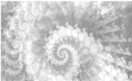
Abbildung 23.4.4.3.2: Startbild (intro.jpg)