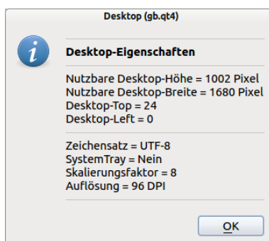
Abbildung 15.6.1.2: Anzeige Eigenschaften Desktop

Public Sub btnGetDesktopInformation_Click() Dim sMessage, sLabel As String sMessage = "<hr><b>Desktop-Eigenschaften</b><hr>" sMessage &= "Nutzbare Desktop-Höhe = " & Desktop.Height & " Pixel" sMessage &= "<br>Nutzbare Desktop-Breite = " & Desktop.Width & " Pixel" sMessage &= "<br>Desktop-Top = " & Desktop.Y sMessage &= "<br>Desktop-Left = " & Desktop.X & "<hr>" sMessage &= "Zeichensatz = " & Desktop.Charset sLabel = IIf(Desktop.HasSystemTray = False, " Nein", " Ja.") sMessage &= "<br>SystemTray = " & sLabel & " Desktop.HasSystemTray sMessage &= "<br>Skalierungsfaktor = " & Desktop.Scale sMessage &= "<br>Auflösung = " & Desktop.Resolution & " DPI <hr>" Message.Info(sMessage) End ' btnGetDesktopInformation_Click()