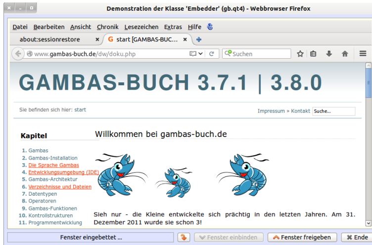
Abbildung 12.5.4.1: Firefox-Fenster im Gambas-Projekt-Programm

Bei der Erprobung des Projekts können Ihnen diese Hinweise helfen: