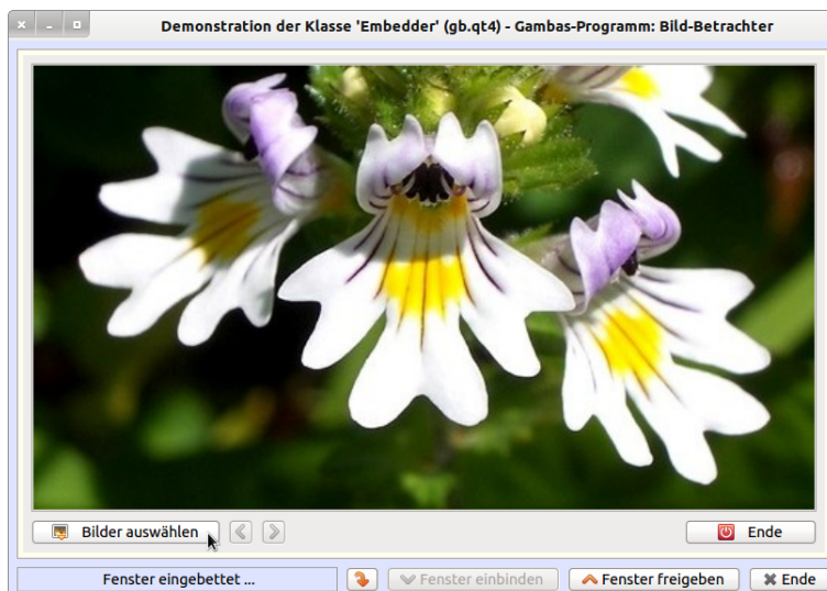
Abbildung 12.5.4.2: Gambas-Programm-Fenster – eingebettet im Gambas-Projekt-Programm